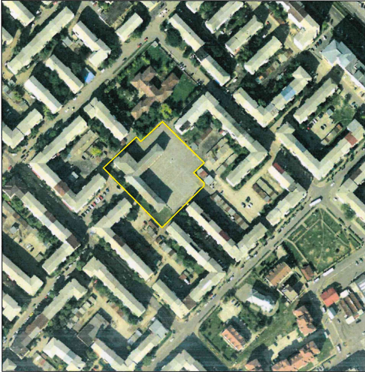
PLAN INCADRARE IN ZONA Mun. Targoviste SCARA 1: 2000